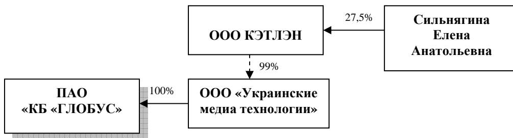
Рис. 1. Структура акционеров ПАО «КБ «ГЛОБУС»» на 01.09.2011 г.

Напомним, что по данным НБУ, 100% акций ПАО «КБ «ГЛОБУС»» принадлежит ООО «Украинские медиа технологии». Агентство позитивно оценивает текущий состав основных бенефициаров Банка. С другой стороны, Агентство не может определить или опровергнуть наличие внешней поддержки у Банка со стороны бенефициаров. По информации самого ПАО «КБ «ГЛОБУС»», его акционеры готовы к увеличению уставного капитала Банка при необходимости. Однако такая готовность определяется имущественным состоянием бенефициаров, а также их желанием совместно вести бизнес и отношениями между ними. Поскольку речь идет о физических лицах, то рассчитать уровень внешней поддержки не представляется возможным.